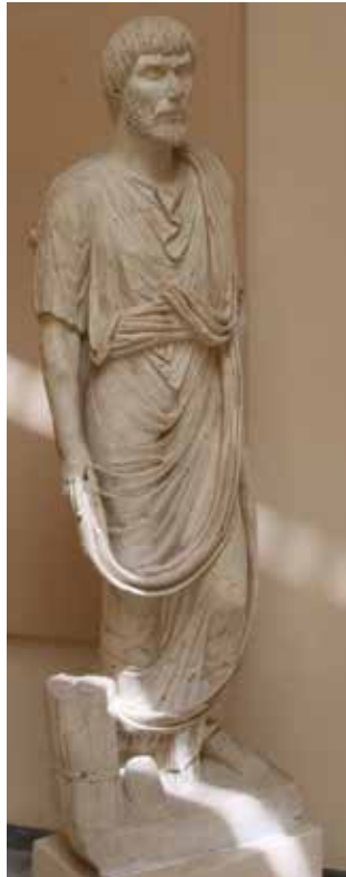
Ostia Antiqua Múzeumában római írástudó szobra, lábánál összekötött könyvtekerccsel

tartalmazó köteg látható. Egy iratkeercs bal alkarja előtt, szétnyitva fekszik. Ez a nagyméretű kőfaragvány Kr. u. 235 körül készült. 13