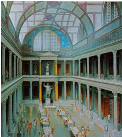
Róma, Trajanus Fórumán az egyik könyvtárterem belső terének rekonstrukciós rajza, James E. Packer-től, Epheszosz, a Celsus Könyvtár, alaprajza