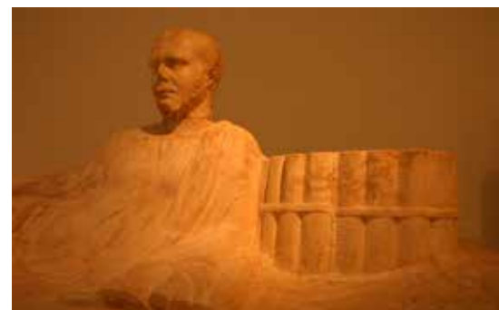
Corvina Kiadó, 1967. p. 63.