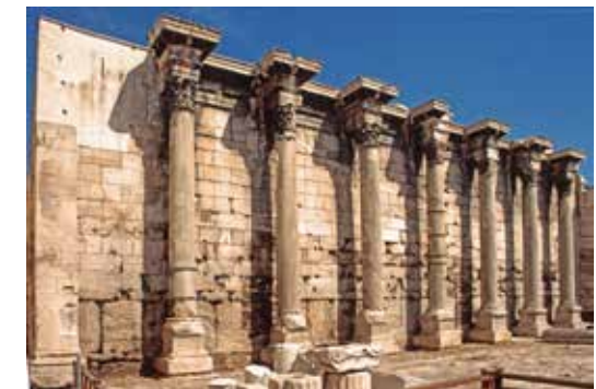
Athén, Hadrianus Könyvtára épületgyűjtésének főbejárat oszlopos homlokzata