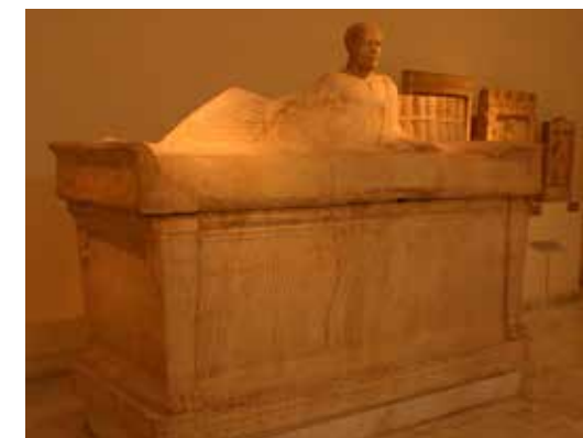
Athén Nemzeti Régészeti Múzeumban, ágy formájú szarkofág tetején, tudós férfiú fekszik, válla mellett, szíjjal összekötött könyvtekerccsel