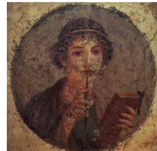
Pompeji IV. Insula occidentalisből nyert freskó tudós hölgyet ábrázol, aki író stylust és írotáblaköteget tart a kezében