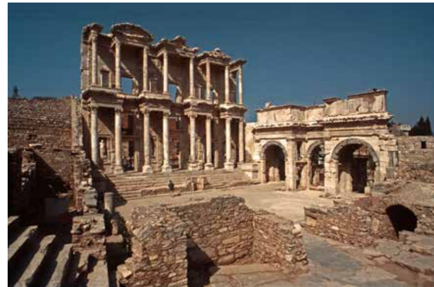
Epheszosz, a Celsus Könyvtár, helyreállított homlokzata, épült 114 és 117 között