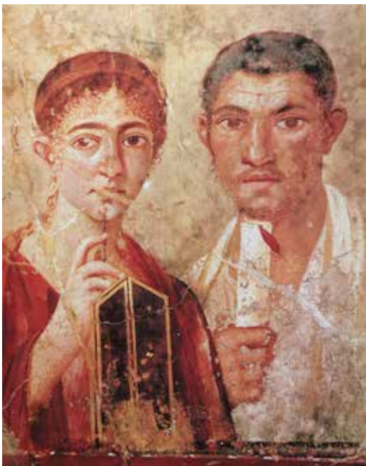
Írástudó házaspár, Paquius Proculus és felesége freskóképe Pompejiben