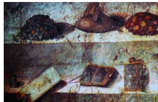
Pompejiben a Julia Felix II, 4, 2 számú udvarházában lévő freskón, íráshoz szükséges eszközök és fölöttük két kupac pénzérme