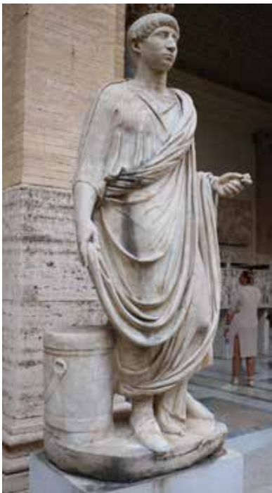
Római tudós szobra, lábánál a könyvtekercs hordozó favödörrel, a Vatikáni Múzeumban