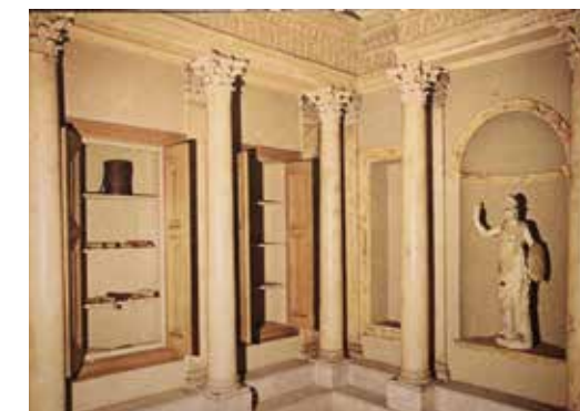
Római könyvtárterem, belső tere rekonstrukciójának másik nézete, az asztalon a könyvtekerce hordozó favödörrel