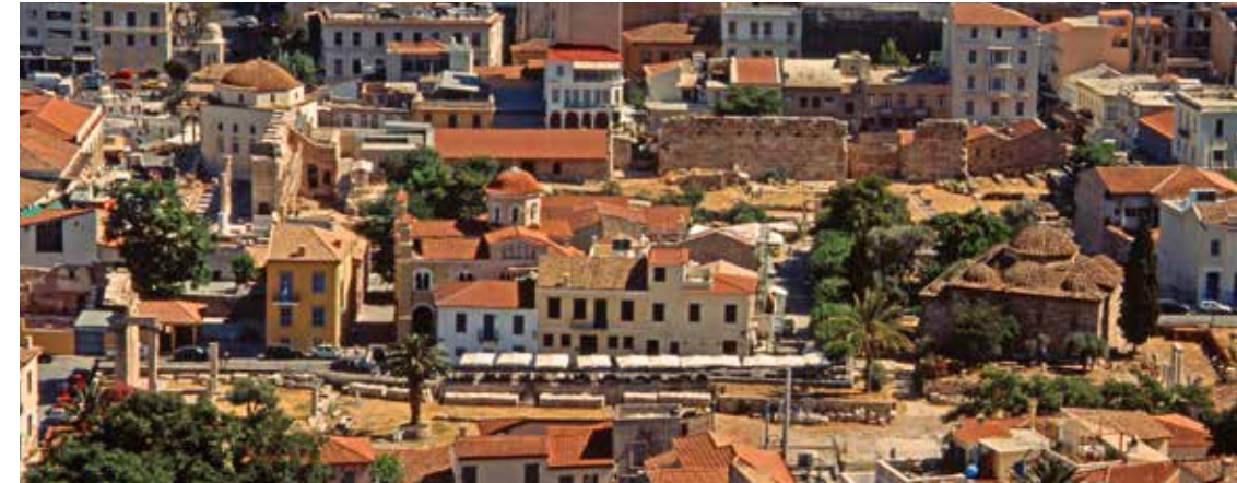
Athén, Hadrianus Könyvtárának romkertje, az Akropoliszról letekintve