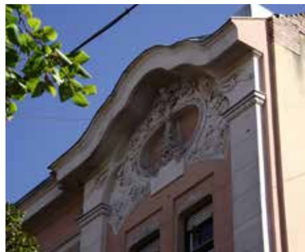
9.) Szeged, Juhász Gyula utca 11. 1907.