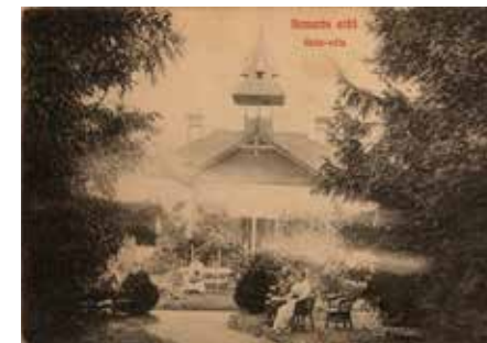
Képeslap, kamaráserdői Reök-villa

27.) Szeged, Tisza Lajos körút 37. – Kálvin tér 2. Református egyházközség bérháza, terv: 1909–1910, kivitel: 1910–1912. Irodalom: BAKONYI 1977, 195. BAKONYI 1980, 151–152. TIPITY 1980, 30 (kat. sz. 207). BAKONYI 1989, 17. BÁTAYI 1989, 4. GERLE – KOVÁCS – MAKOVECZ 1990, 130. BÁTAYI 1990, 4. NAGY 1991, 197. MAGYARKA 1991, 933. TÓTH 1993,