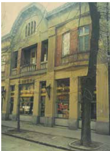
Széchenyi-ház. Gerle János felvétele, 1990 körül. BFL XIV.243.c. 1/94, pag. 39.

21.) Kaposvár, Csiky Gergely Színház, terv: 1909–1911 (Stahl Józseffel), kivitel: 1910–1911, rekonstrukció: 2017. Irodalom: Somogyvármegye , 1911. október 17. 3. Somogyvármegye , 1911. október 28. 1. BAKONYI 1977, 194–195. NÉMETH (szerk.) 1981, 67. BAKONYI 1989, 15–16, 22. GERLE – KOVÁCS – MAKOVECZ 1990, 130.