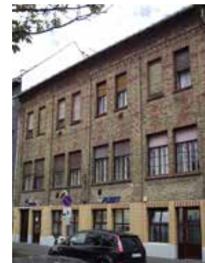
Szeged, Dáni utca 6, hom- lokzati részlet (A szerző felvétele)

Irodalom: Építő Ipar , 37. évf. 34. sz. 1913. augusztus 24. 373. BAKONYI 1977, 194. BAKO- NYI 1989, 14–15, 22. GERLE – KOVÁCS – MAKO- VECZ 1990, 130.