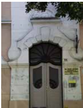
Szeged, Juhász Gyula utca 11, homlokzati részletek