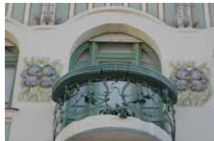
Reök-palota. Homlokzati és lépcsőházi részlet (A szerző felvételei)

1980, 20, 21, 24, 25 (kat. sz. 80, 87, 134, 135, 155, 156). NÉMETH (szerk.) 1981, 99–100, 344. RÉV 1983, 154. BAKONYI 1989, 10–13. GERLE – KOVÁCS – MAKOVECZ 1990, 130, 131. NAGY 1991, 197. HABERMANN 1992, 234–235. BAKONYI [1974] 1995, 87–88. LACZÓ 1995, 89–90. KOCZOR – FEKETE 1995, 91–92. MORAVÁNSZKY 1998, 101–102. TÓTH (szerk.) 2000, 565–567. BLÁZOVICH 2005, 134. RÉTI 2008, 15–18.