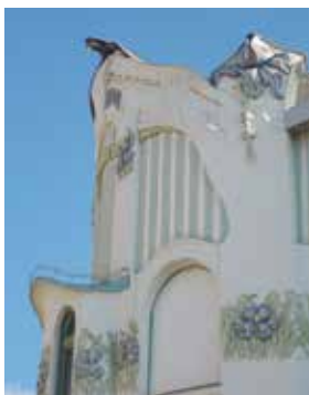
Reök-palota. Homlokzati részletek (A szerző felvételei)