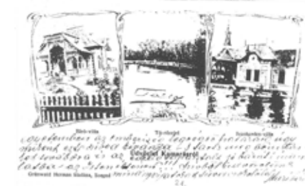
Képeslap. BFL XIV.243.d. 1/71, pag. 20.