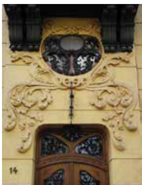
Szeged, Arany János utca 14.;