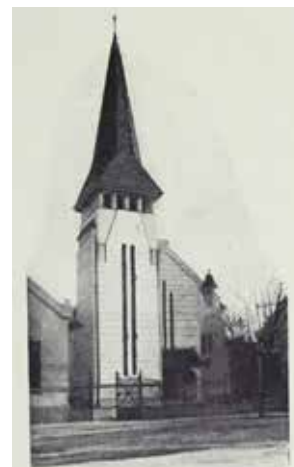
Nagyki- kinda. BOROVSKY 1912, 591.

Irodalom: BAKONYI 1977, 195. BAKONYI 1989, 16–17, 22. GERLE – KOVÁCS – MAKOVECZ 1990, 130.