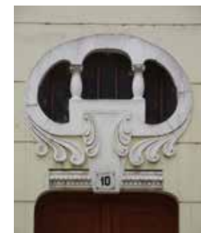
A Tedeskó-ház homlokzati részlete

8.) Szeged, Párizsi körút 39. 1906, lebontva. Irodalom: BAKONYI 1989, 22.