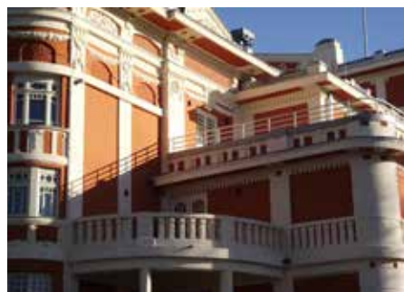
Csiky Gergely Színház. Külső és belső részletek

22.) Szeged, Református temető, Reök család sírboltja, 1910. Irodalom: BAKONYI 1989, 22.