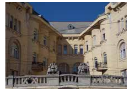
Főhomlokzati részletek (A szerző felvételei)