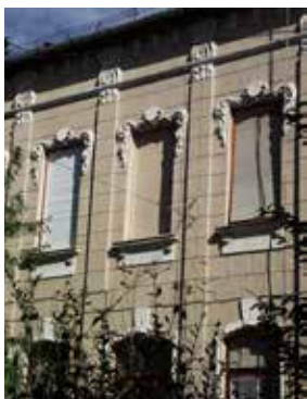
Szeged, Szűcs utca 9. homlokzati részlet