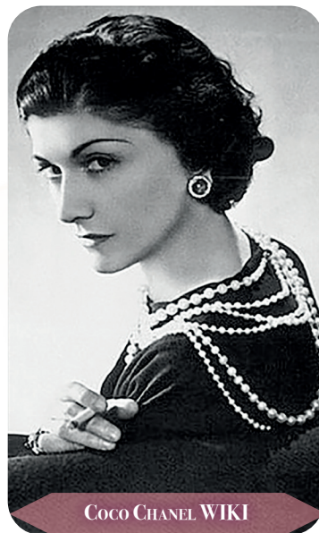
COCO CHANEL WIKI

A kiegészítők leginkább gyöngysorokból álltak, melyek akár rétegezve, gyakran derékig értek. A tollboák, a strasszokkal díszített fejdíszek és homlokpántok, valamint a cigarettatartók növelték a megjelenés fényét. A férfiaknál a kényelmes, puha gallérú öltönyök és mellény nélküli viselet, a nőknél pedig a rövid bubifrizura, a T-pántos cipők és az art deco ékszerek és kiegészítők voltak jellemzőek.