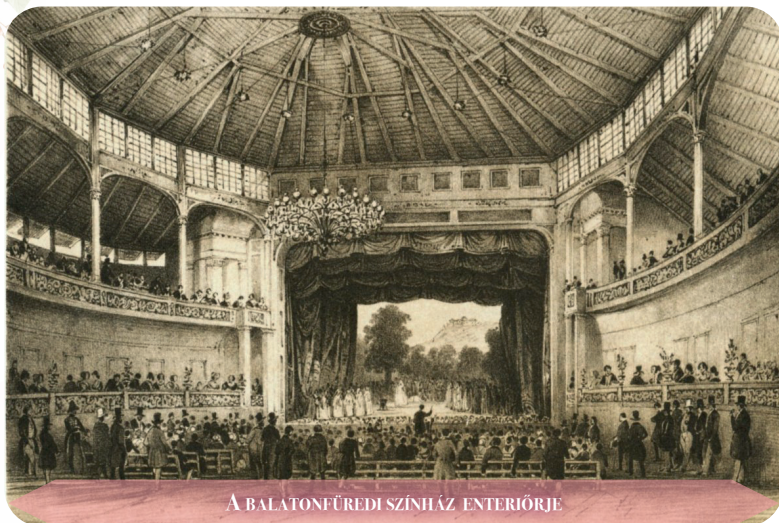
A BALATONFÜREDI SZÍNHÁZ ENTERIÓRJE