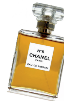
COCO CHANEL HÍRES PARFÜMJE

kARRIERJE egészen a csúcsig. Stílusát nagyban befolyásolták a záróban töltött évek, tervezőmunkáját áthatotta a korlátmentesség.