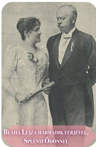
BLAHA LUJZA HARMADIK FÉRJÉVEL, SPLÉNYI ÖDÖNNEL

A füredi színházban fellépő színész nő közkedvelt személyiséggel és kiváló alakításaival országszerte népszerűségnek örvendett, így nem csoda, hogy az Anna-bálra invitálás meghozta gyümölcsét.