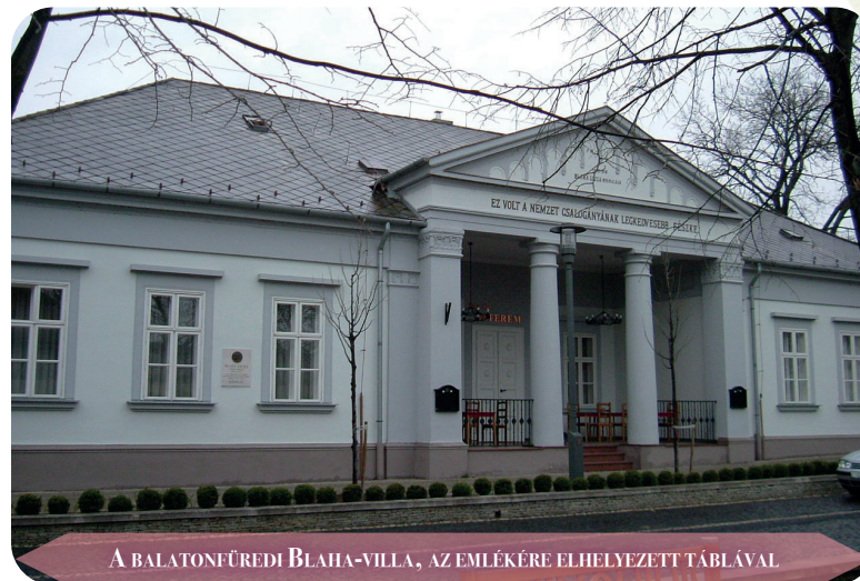
A BALATONFÜREDI BLAHA-VILLA, AZ EMILÉKÉRE ELHELYEZETT TÁBLÁVAL

„Múlt vasárnap délután lépett föl Blaha Luiza asszony a balatonfüredi színházban, a kórház javára rendezett jótékony célú előadásban. Az »Ingyenélők«-et adták és a művész nő szokott művészetével, de meg a szokottnál is virágosabb jókedvében játszotta szerepét.