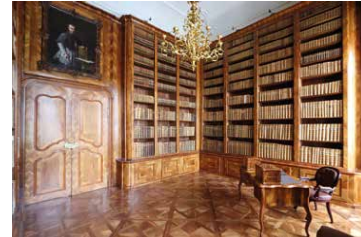
A könyvtárterem, északi falnézete, az ablakok körüli intarziás fa falburkolattal

A könyvtárszobában, korábban, egy archív fotó tanúsága szerint, a tudományos eszmecserek számára, a kerek asztal körül, az 1790-es években készült, directoire-romantikus stílusú ülögarnitúrát helyeztek el. A kanapé, a karosszékek és a székek támláiban preromantikus csúcsíves pálcafonat kereszteződéseket látunk. 31 A felújítás