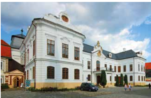
Veszprém, Fellner Jakab építész tervei szerint, 1765 és 1772 között épült Érseki Palota, nyugati főhomlokzata. A könyvtárterem két ablaka az északi oldalhomlokzat első emeletén, a 3. és 4. ablaktengely mögött van