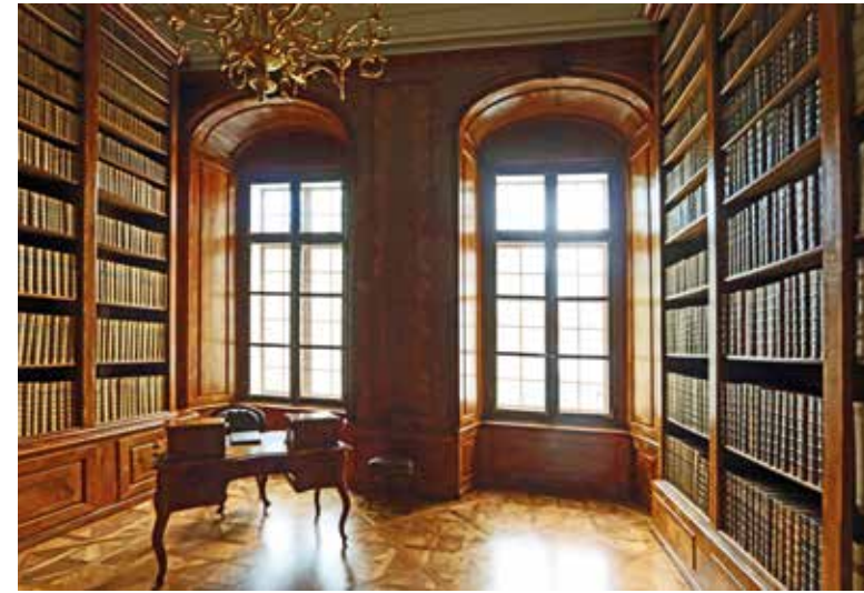
Az Érseki Palota, a könyvtárterem, északi falnézete, az ablakok körüli intarziás fa falburkolattal

Nincs így a bejáratától jobbra lévő, az ablakra merőleges falon látható, négy függőleges szakaszra osztott nagy-könyvszekrényénél, mert annak lábazati konstrukciójában nincs szekrény, és így az alacsonyabb, mint a levéltári szekrények és az ablak alatti parapet faburkolata. A két ablak közé, nem állítottak könyvszekrényt, de a belső