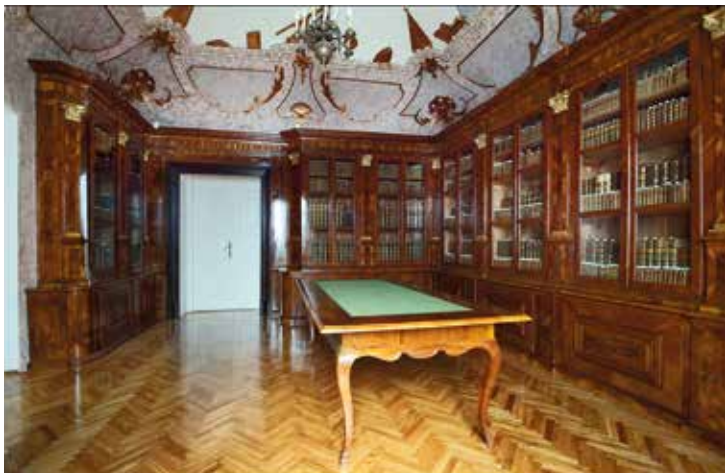
Padányi Bíró Márton kastély-könyvtártermének, belső tere, a bejárati ajtó felé tekintve és a homlokzati ablak irányát jelölve az Iparművészeti Múzeumban