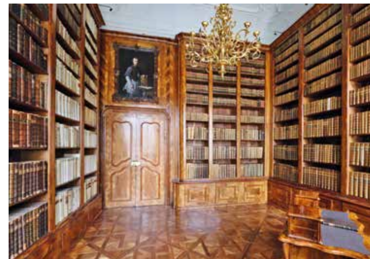
Érseki Palota, a könyvtárterem keleti, déli és nyugati belső falnézete a barokk könyvszekrény együttesével. A bejárati ajtó fölött Koller Ignác püspök portréfestményével