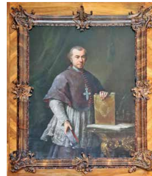
A bejárati ajtó fölött lévő, Koller Ignác, aki 1762 és 1773 között volt veszprémi püspök, az Érseki Palota, a könyvtárterem építtetőjének és könyvgyűjtőjének. portréfestménye