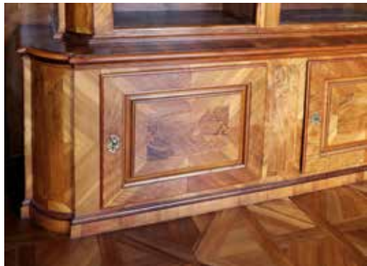
Az Érseki Palota, a könyvtárterem könyvszekrényeinek alsó levéltári szekrényesora

A könyvtárajtók és a könyvszekrények szimmetrikus, 45°-os diófa furnérozású erezete, valamint a könyvszekrények lábazati zárt szekrényosorának, formai karaktere, emlékeztet, a sümegi könyvtárterem bútorzatára. Valószínű, hogy itt is dolgozott, Johannes Wachtländer veszprémi püspöki asztalosmester, a bútoregység egyszerűsödött. A sümegi gazdag záró párkányforma helyett, Veszprémben a párkány egy ívhajlatá egyszerűsített.