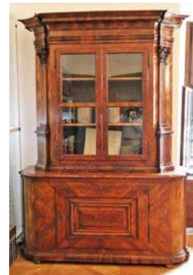
Padányi Bíró Márton kastély-könyvtártermében, 2021-ben elhelyezett barokk könyvszekrény előlnézete

Padányi Bíró Márton éves jövedelme 20 000 Forint volt, azonban a kastélyra 100 000 Forintot költött. Ugyanakkor pályafutása során a püspökség jövedelméből fölépített 88 templomot, 48 plébániaházat, felújított 109 templomot és 39 plébániaházat. Kiváló szorgalmas tudós alkotó volt.