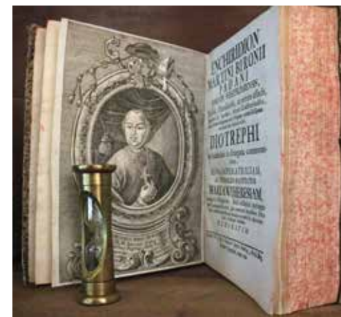
Padányi Bíró Márton által írt, teológiai, hitvédelmi mű, az 1750-ben megjelent „ENCHIRIDION”, a sümegi könyvtárterem, 2021-ben elhelyezett barokk könyvszekrényében