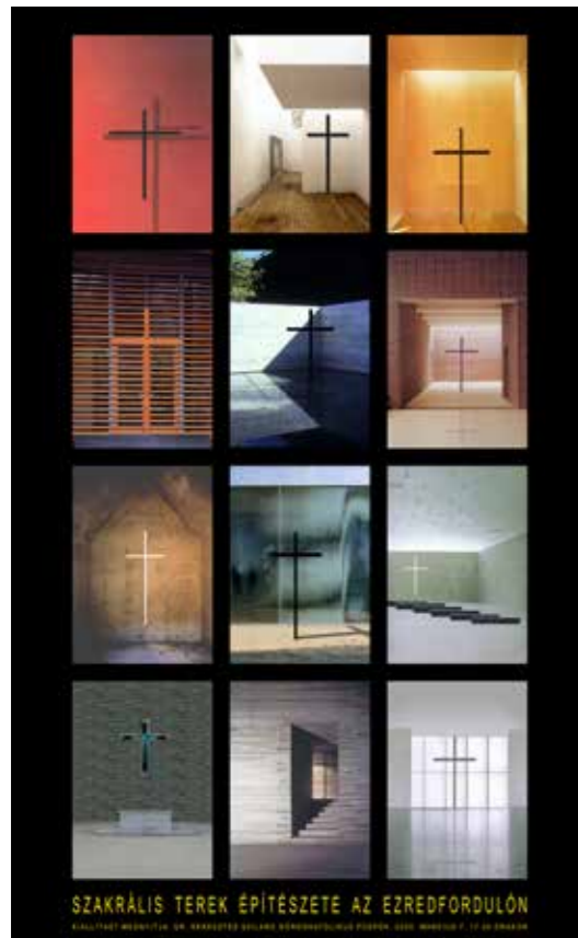
4. kép: Szakrális terek építészete az ezredfordulón, kiállítás plakát (BME Aula, Budapest, 2005) 5. kép: 10 év szakrális, kiállítás plakát (FUGA, Budapest, 2011)

tően az utóbbi évek új kutatási irányait mutatjuk fel. Ezáltal – remélhetőleg – láthatóvá válnak a tématerület, a „szakrális” oktatásának kimeríthetetlen lehetőségei. (4–5. kép)