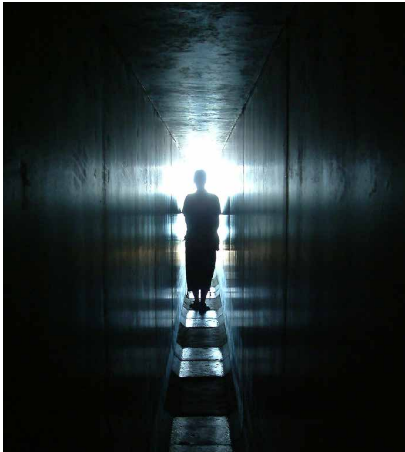
1. kép: Megtett út – a világ másik felén, Naoshima