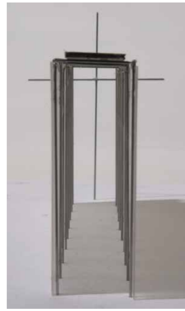
10. kép: Út és kereszt, efemer kápolna installációja