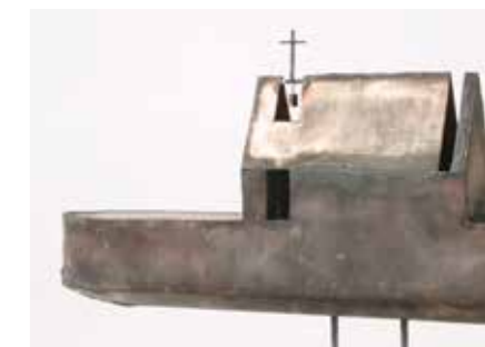
11. kép: Alterációs vonalak térbelisége, efemer kápolna installációja